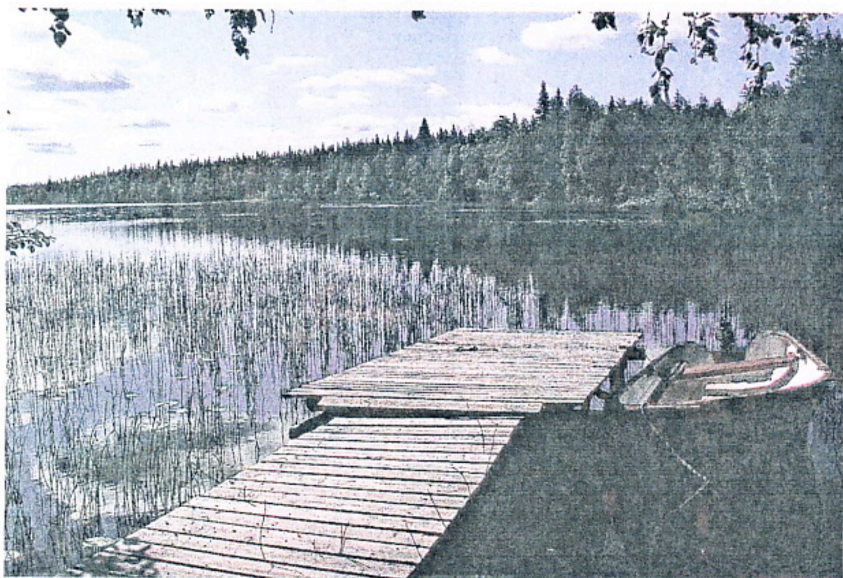
Oupplarat mord. Här i Björkvattnet hittades en död man 1929 som bragts om livet. Han kunde aldrig identifieras och mördaren gick fri.