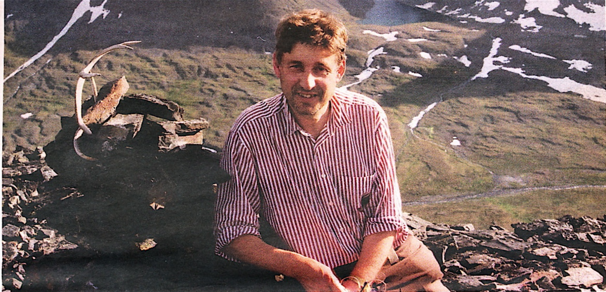
Pältsas sydtopp. Tycker att Gyllene triangeln är ett passande smeknamn för detta sköna område längst i norr - här finns bland annat Laestadiusvallmon men den används inte för opiumtillverkning som i den "riktiga" Gyllene triangeln.